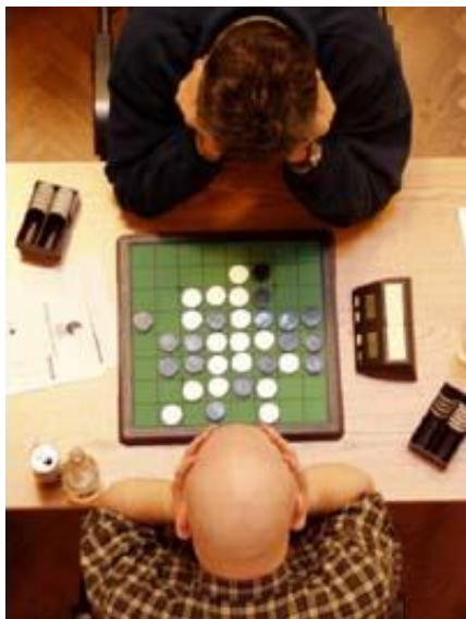
Deux joueurs d'Othello

Les prépositions sont des mots tels que ‘avec’, ‘à’ et ‘par’, et bien que cela soit considéré comme correct de former des phrases d'une telle manière qu'elles ne se terminent pas par un tel mot, ce n'est pas techniquement une règle pure-et-dure de grammaire et quiconque dit le contraire est dans l'erreur. Donc la prochaine fois que quelqu'un vous demande “What are you looking at?” (Qu'est-ce que vous regardez), vous n'avez pas besoin de répondre “Actually, you should say ‘At what are you looking?’” (Actuellement, vous devriez dire ‘Vers quoi regardez-vous ?’)